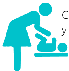
Comunicar lactancia y parto: Anexo III