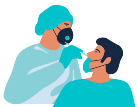
Comunicar síntomas: Anexo II