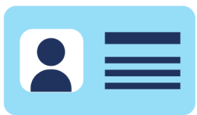
DNI o pasaporte