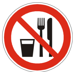
Salvo excepciones, no está permitido comer